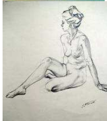
Le Lundi 10.02.14 Galerie de portraits. Séance spéciale. Temps variable