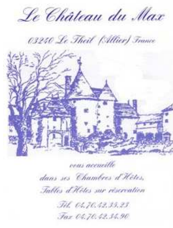
Château du Max