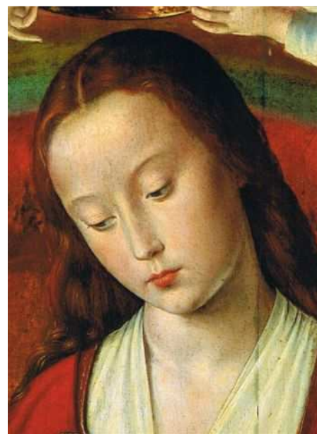
Vierges de Moulins - Visage

ARPLASTIX vous souhaite un JOYEUX NOËL qui s'approche et vous adresse, ainsi qu'à votre famille les vœux anticipés pour une très bonne et heureuse année 2008